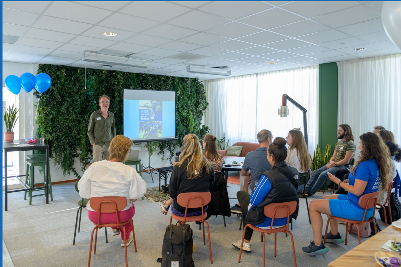
Presentatie founding fathers tijdens de Sociale Sportschool communitydag.