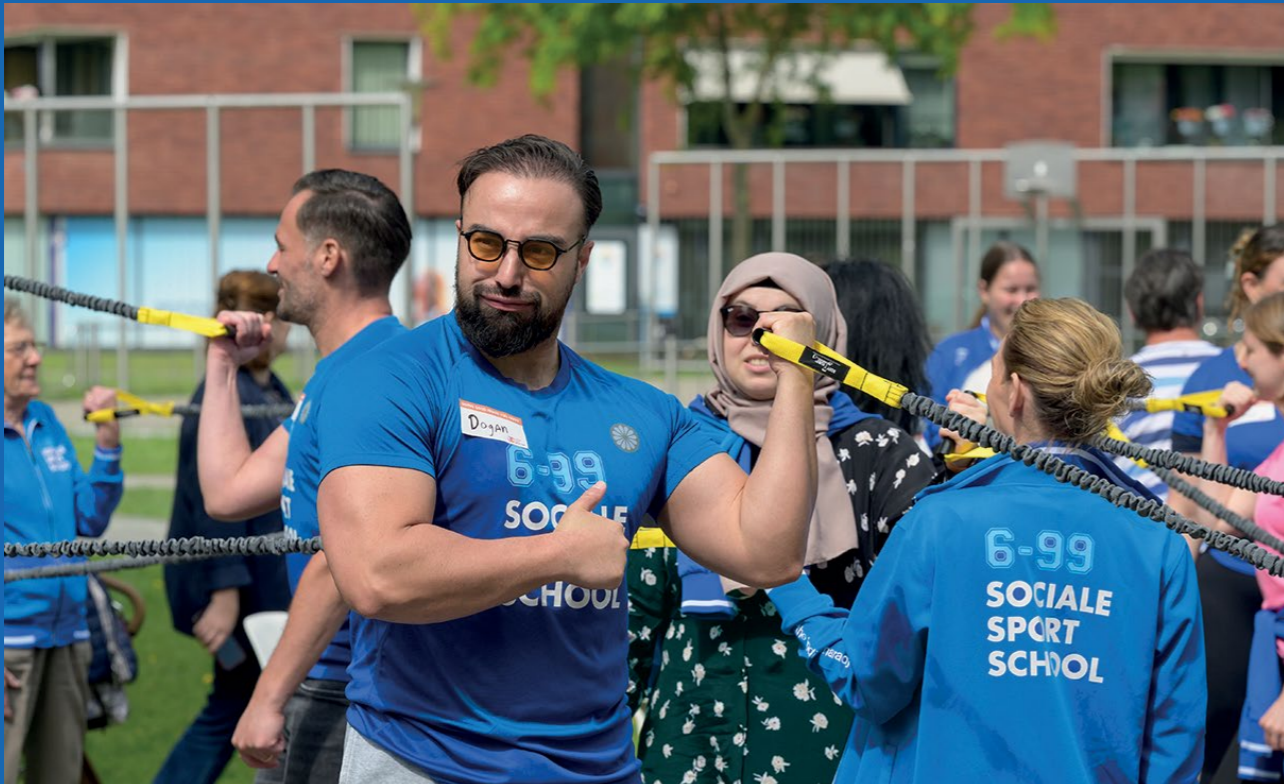
Bedrijfsvrijwilligers tijdens een bootcamp bij Vitalis Berckelhof in Eindhoven.

projectleiders. Dit resulteerde in een adviesrapport. Naar aanleiding hiervan heeft het bestuur de eerste stappen gezet met het formuleren van een visie en missie tot 2030, een strategisch kompas voor verdere groei en positionering.