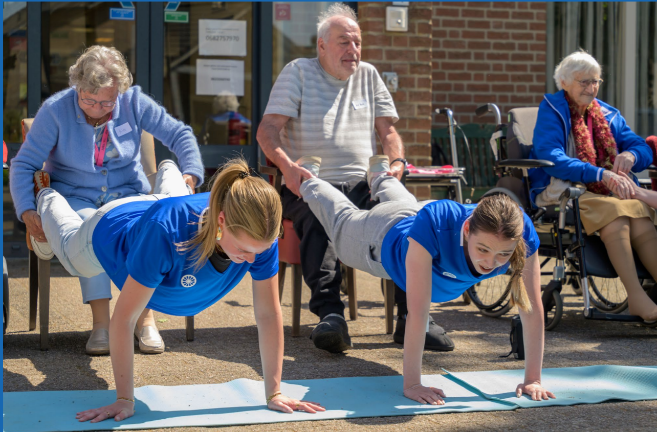
Samenwerking met leerlingen van het Motion Beweeg College in Zoetermeer.