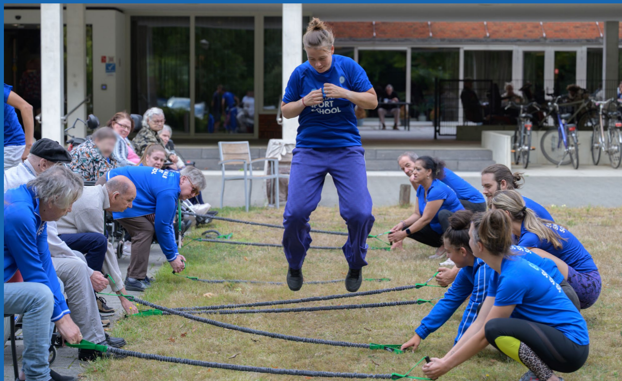
Bootcamp tijdens de Sociale Sportschool communitydag.