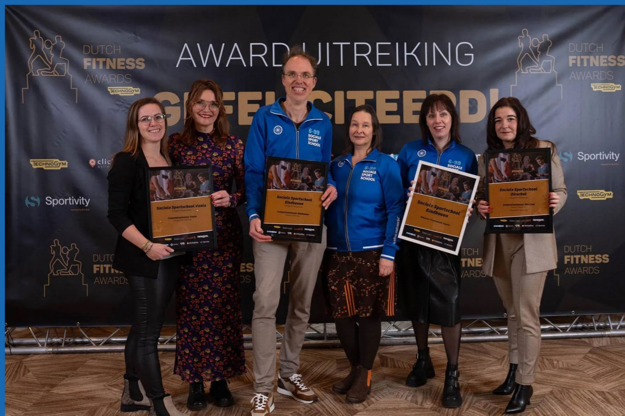
Prijzenregen voor de Sociale Sportschool tijdens de Dutch fitness Awards.