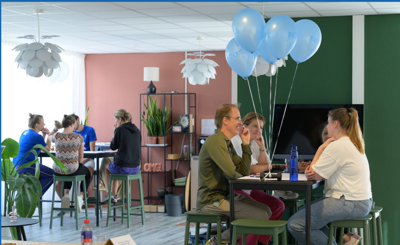
Workshops om elkaar te inspireren tijdens de Sociale Sportschool communitydag.